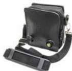
Etui do noszenia wypiętego panelu sterowania