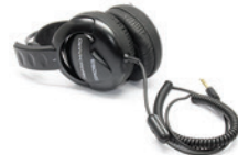
Słuchawki przewodowe Koss